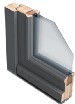
Mit Glasleiste außen (Modellreihe Cardea)