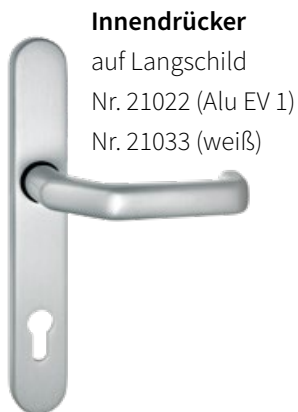
Innendrücker auf Langschild Nr. 21022 (Alu EV 1) Nr. 21033 (weiß)