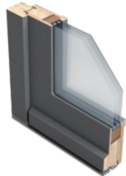
Ohne Glasleiste außen (Modellreihe Novus)