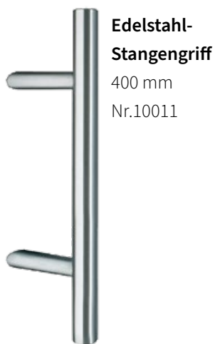
Edelstahl-Stangengriff 400 mm Nr.10011